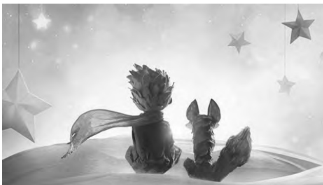
Le Petit Prince – Film d'animation 2015

ANTOINE DE SAINT-EXUPÉRY, EXTRAIT DU PETIT PRINCE